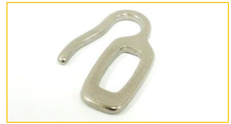
マッシュアップッド専用箱足