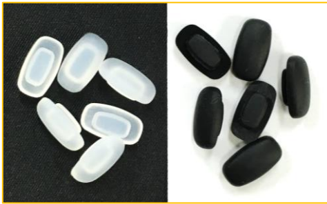
MP-03(クリアマット、ブラックマット)