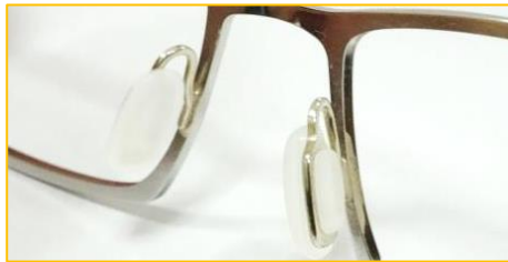
マッシュアップッド使用例②