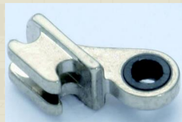
180度埋め込み丁番 (曲智用 横埋め込み)