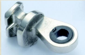
90度埋め込み丁番 (前埋め込み)