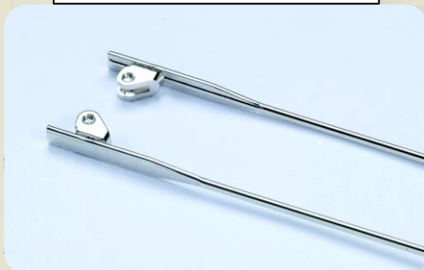
丁番開閉時のアガキ (Nom)