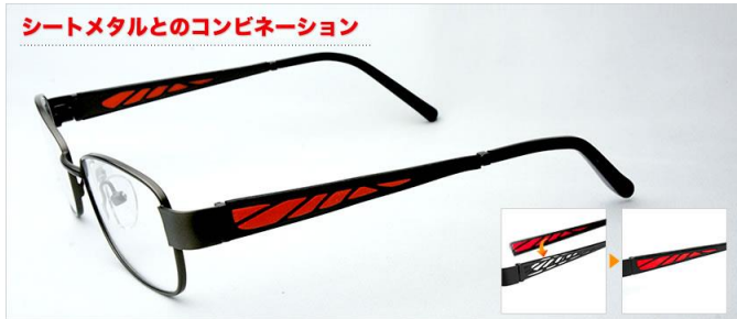
シートメタルとのコンビネーション