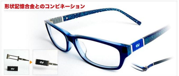
形状記憶合金とのコンビネーション