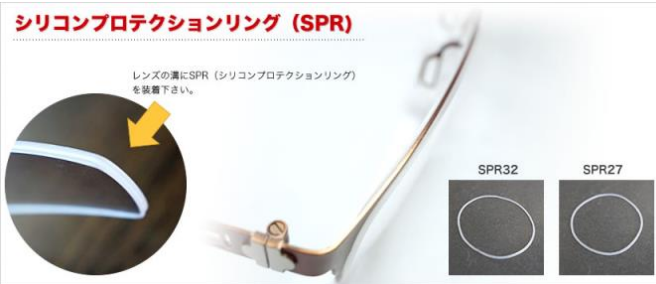
シリコンプロテクションリング (SPR)