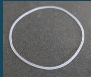
SPR27 (27φ X 0.5mm)