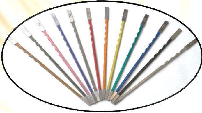
スタンダードカラー