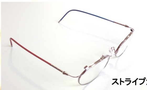
ストライプカラーも素敵！