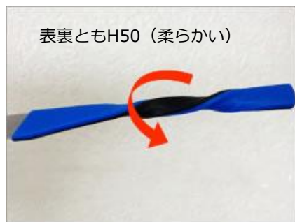
素材が柔らかいため 簡単に回ってしまいます