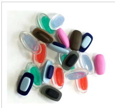
ツートンカラーも可能です

シリコンは熱成型で作られるので、異なる色や硬さを組み合わせた商品を製作できます。モダンなどは、素材の伸縮性が高過ぎて、捻じれてしまうことがありますが、下の写真のように異なる硬さを組み合わせることで回りにくくする効果があります。