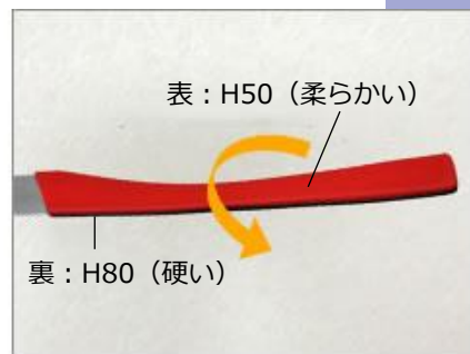
回りにくくなります